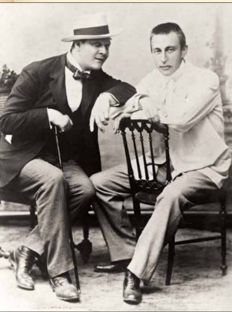
Ф.И. Шаляпин и С.В. Рахманинов. Начало 1890-х гг.

– Я не знаю, в чем дело. Просто, когда пою Варлаама, я ощущаю, что я Варлаам, когда Фарлафа, что я Фарлаф, когда Дон Кихота, что я Дон Кихот. Я просто забываю себя. Вот и все. И владею собой на сцене. Я, конечно, волнуясь, но слышу музыку, как она льется. Я никогда не смотрю на дирижера, никогда не жду режиссера, чтобы меня выпустил. Я выхожу сам, когда нужно. Мне не нужно указывать, когда нужно вступить. Я сам слышу.