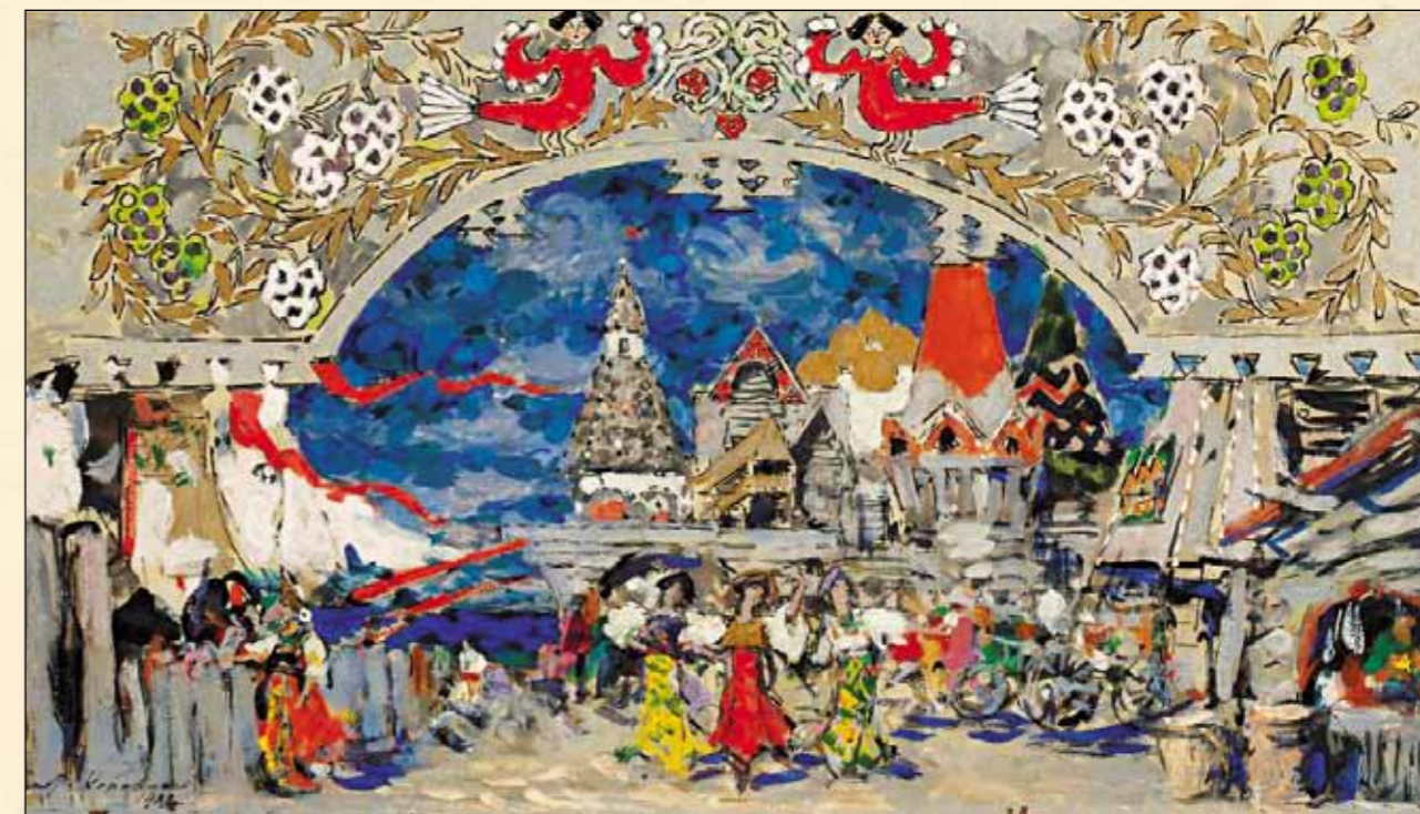
К.А. Коровин. Торговая площадь в Град-столице. Эскиз декораций к балету Ц. Пуни «Конек-Горбунок». 1901

В это время в уборную к нему зашел великий князь Владимир Александрович.