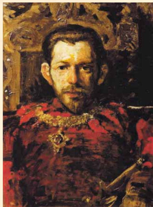
К.А. Коровин. Портрет С. Мамонтова в театральном костюме. Середина 1880-х гг.

– Он же был этаким барин, капризный. Все, что ни скажу, все ему не нравилось. Он мне сказал: «Вы же не певец, а передвижная выставка, вас заела тенденция. Поете “Блоху”, “Как король шел на войну” – кому-то нравится хотите. В искусстве не надо пропаганды». Вообще, сказать тебе должен, что я его не понимал и картины его не пони-