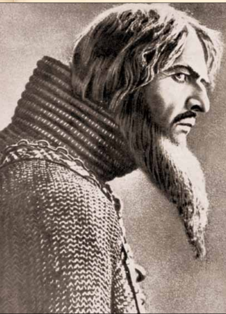
Ф.И. Шаляпин в роли Ивана Грозного (Н.А. Римский-Корсаков «Псковитянка»). Париж, 1909

Я не видел Шаляпина, чтобы он когда-либо читал или учил роль. И все же – он все знал и никто так серьезно не относился к исполнению и музыке, как он. В этом была для меня какая-то неразгаданная тайна. Какой-либо романс он проглядывал один раз и уже его знал и пел.