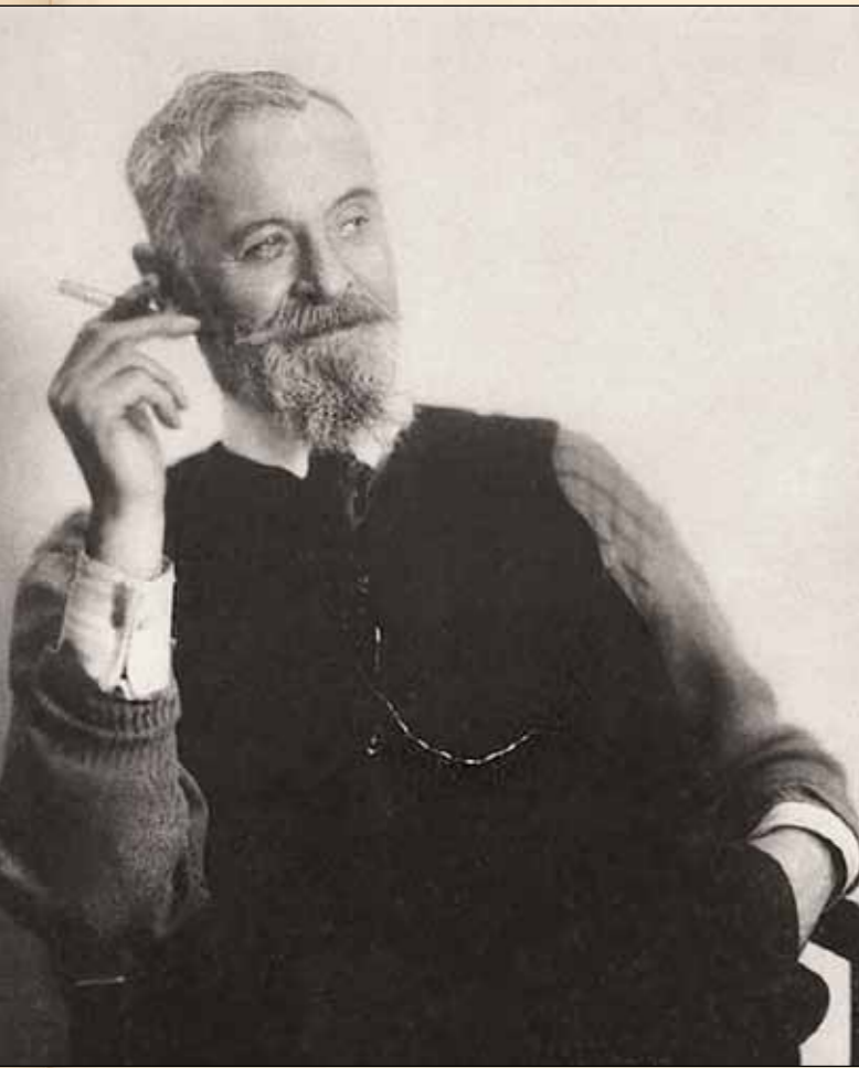
К.А. Коровин. Начало 1930-х гг.

да, которая поможет любовью и вниманием создаться артисту?