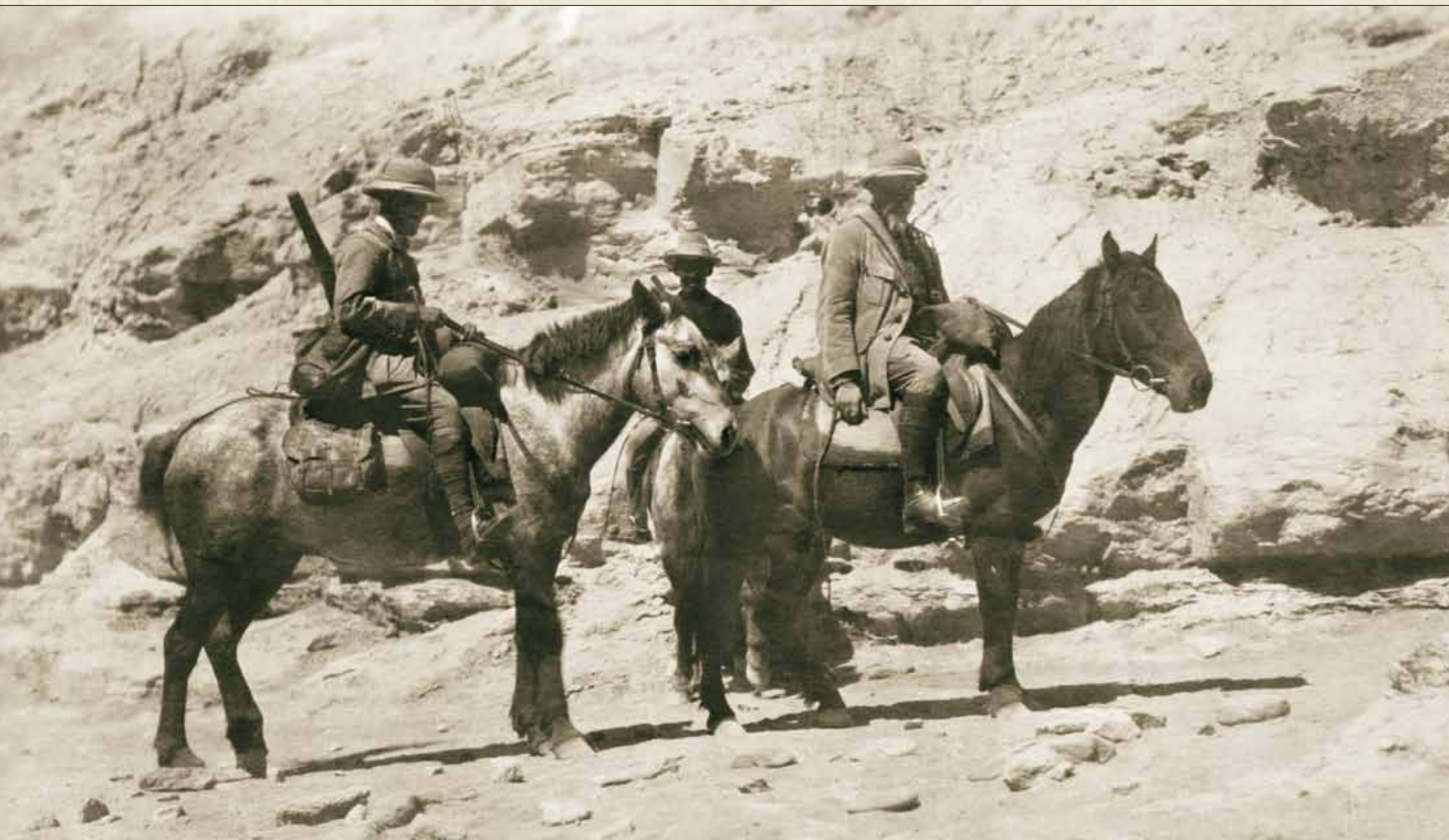
Юрий Николаевич и Николай Константинович Рерихи. Китайский Туркестан, 1926