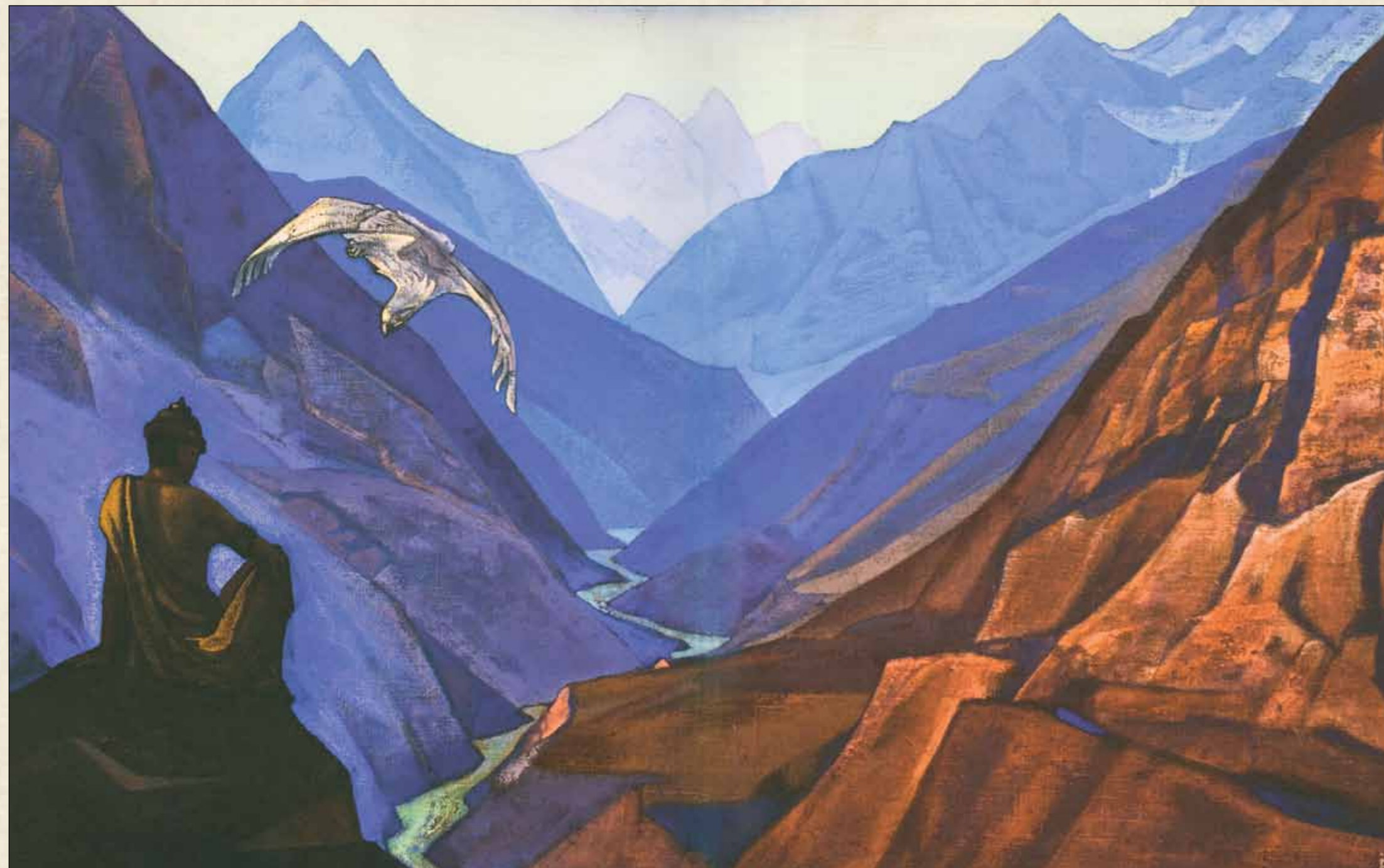
Н.К. Рерих. Приказ Учителя. 1947

Думается, что над этой сравнительно небольшой по объему текста книгой можно будет размышлять не один год. Путешествие в метаисторический мир Рерихов, таинственный и загадочный, связанный с космической эволюцией нашей планеты, не проходит бесследно. Такое путешествие помогает совершаться важнейшему для нашей духовной эволюции действию – расширению сознания, без которого невозможно постигать космическую реальность и двигаться вперед.