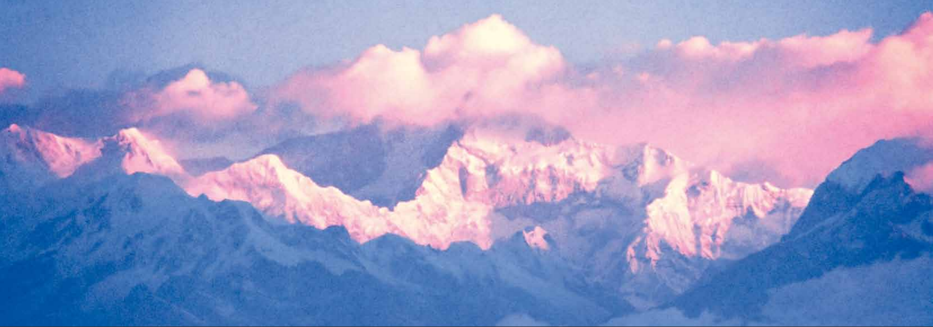
Канченджанга. Сикким. 1970-е гг.

дов и тем, что происходило накануне и во время Второй мировой войны. Метаистория этой войны ожила и запечатлелась навеки на полотнах великого художника.