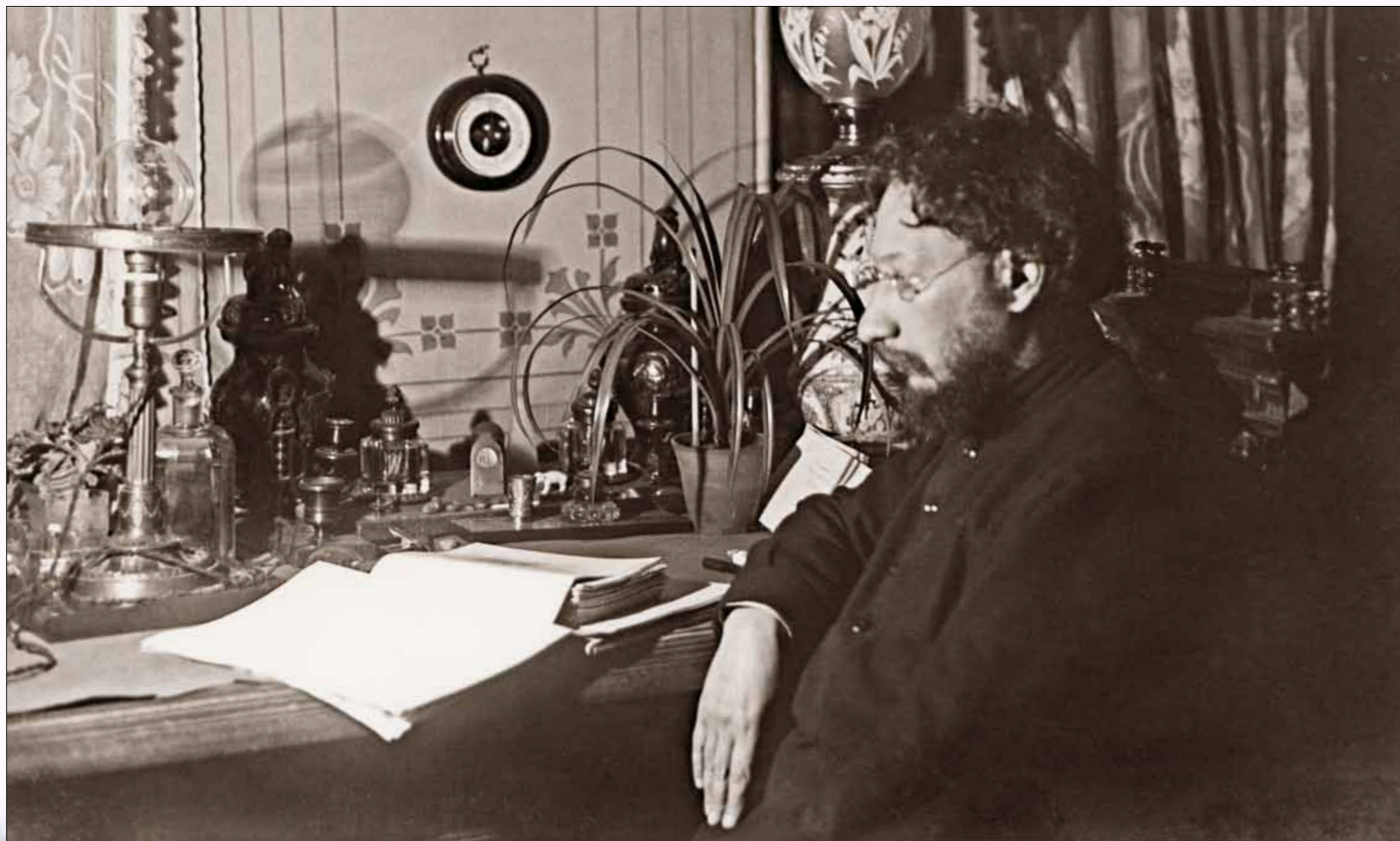
П.А. Флоренский в своем кабинете. Сергиев Посад. Нач. 1930-х гг.