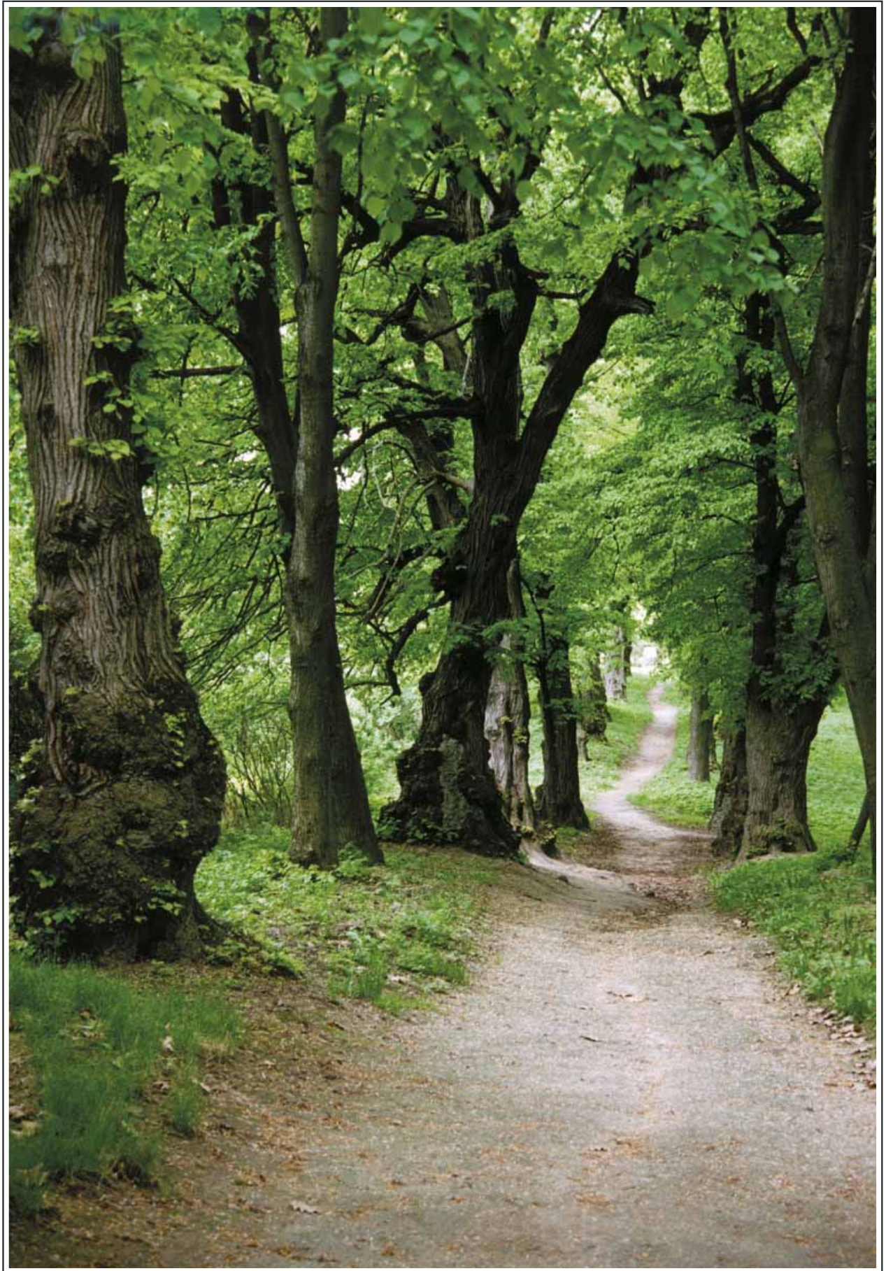
64. Имение Н.И.Пирогова в селе Вишня вблизи Винницы. Липовая аллея. Фото 2000-х