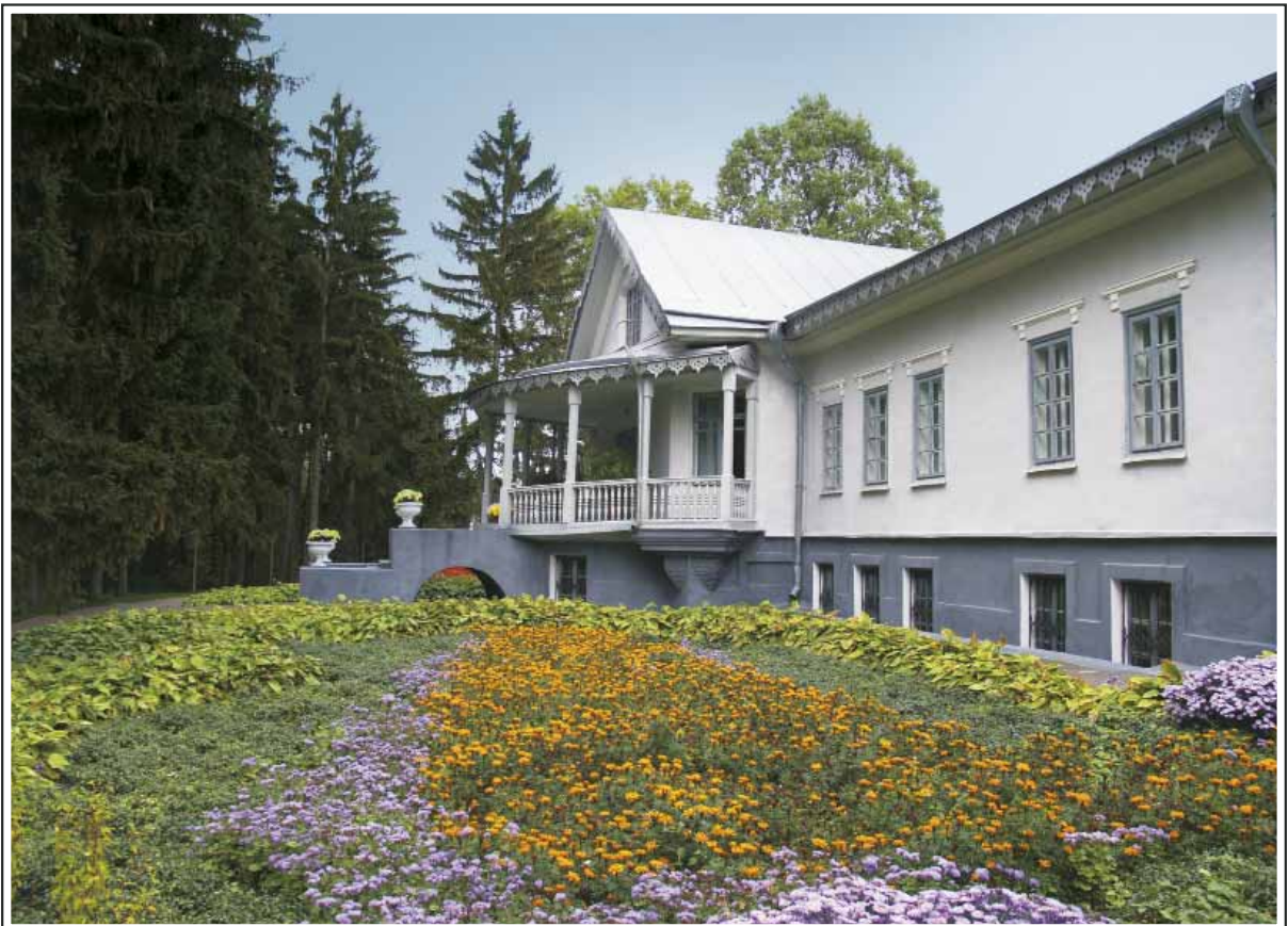
65. Кабинет Н.И.Пирогова в его имени в селе Вишня. Фото 2000-х