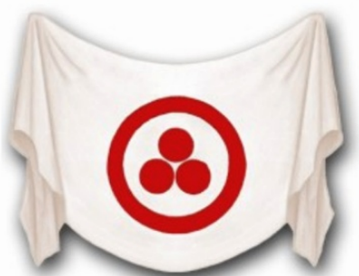
Символ Пакта Рериха

Конференция «Перспективы развития современного общества» проводится в рамках двадцатой ежегодной научно-практической конференции «Осознание Культуры — залог обновления общества».