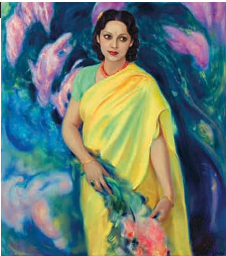
С.Н.Рерих. Мадам Девика Рани Рерих, 1946. 162,9х114,3. Счетная палата РФ установила, что в ГМВ ее размеры 52,5х57,5