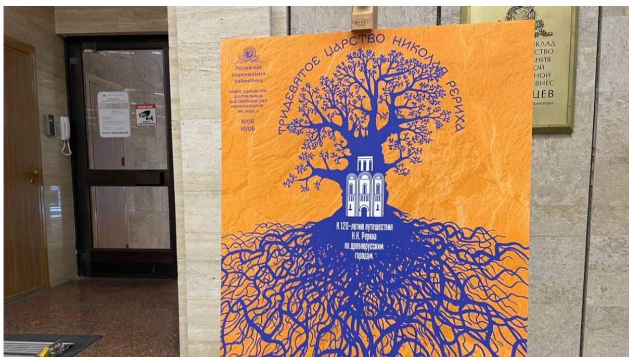
Афиша выставки Рериха в РНБ.

Торжественное событие — 88 лет со дня подписания Пакта Рериха в Российской национальной библиотеке (РНБ) планировали отметить в середине апреля. Для этого Международный Центр Рерихов (МЦР) привёз в Петербург часть своей коллекции. Однако накануне открытия только что установленную выставку начали демонтировать, а сотрудников Центра ещё неделю не пускали к экспонатам. При этом выставку в честь Рериха читателям РНБ всё-таки показали — правда, уже в середине мая, да и количество экспонатов сильно сократили. MR7 поговорил с вице-президентом МЦР о том, почему библиотека решила «отменить» художника и его последователей.