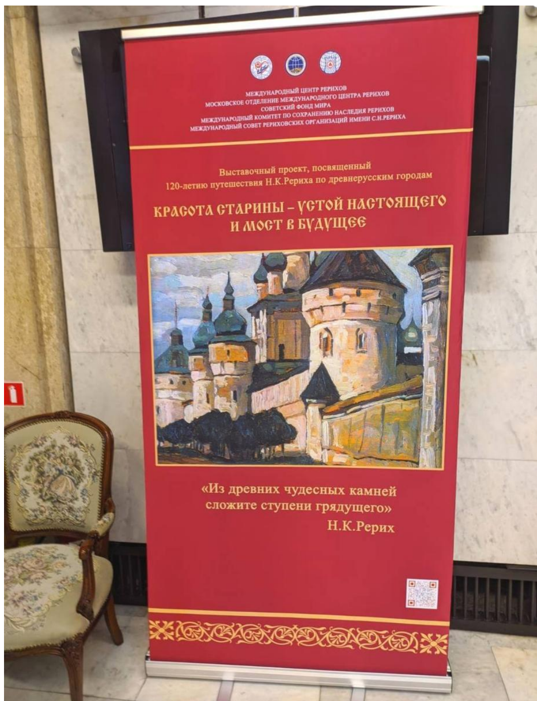
Афиша экспозиции, которую подготовил Центр Рерихов.